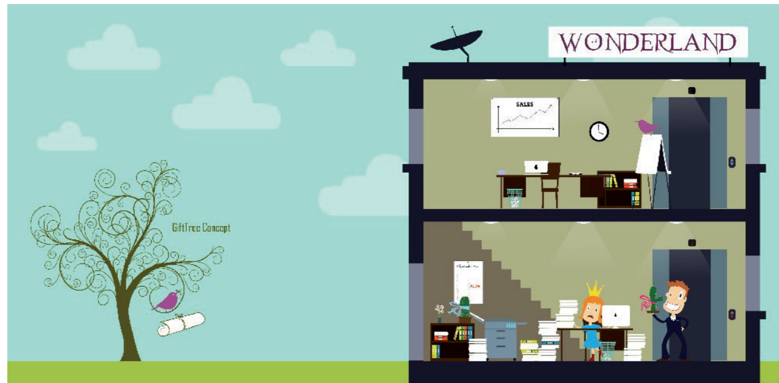
KLANT: INXCO BVBA DUUR: 3MIN