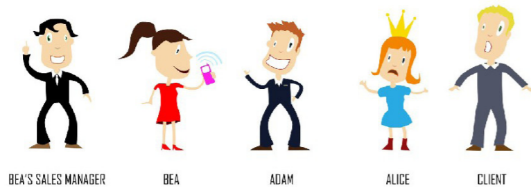
BEA'S SALES MANAGER